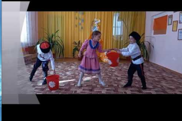
Парная казачья пляска