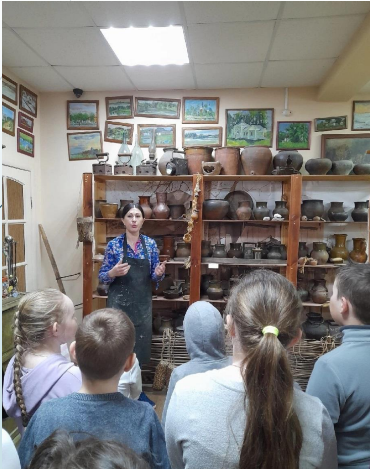
Арт студия г. Йошкар-Ола