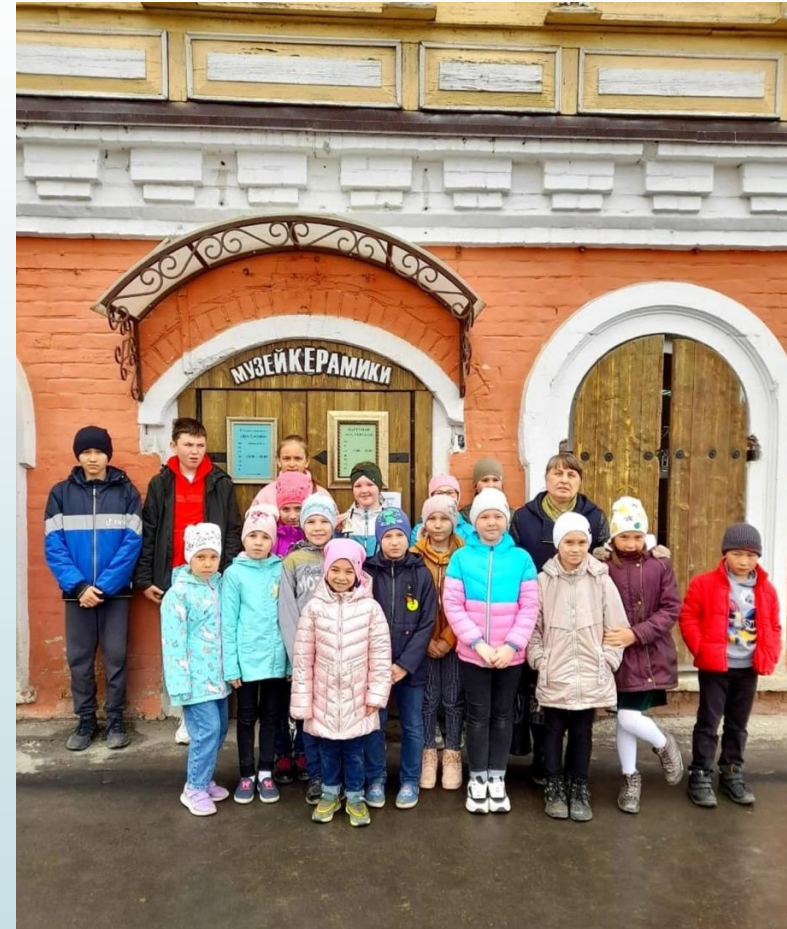
Музей керамики г. Йошкар-Ола