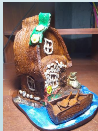
Выставка моих керамических работ