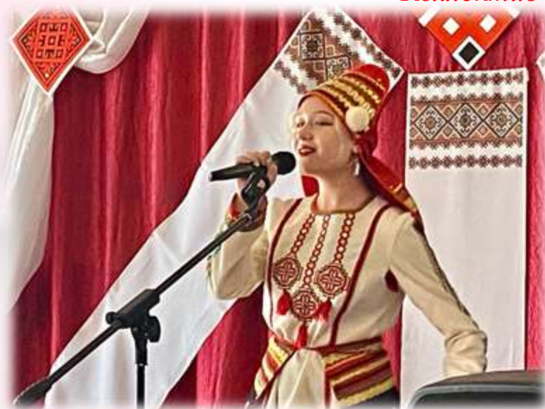
Солистка Лицея №1 р.п. Чамзинка