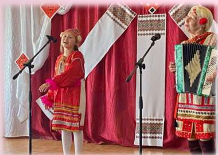
Дуэт Комсомольской СОШ №1