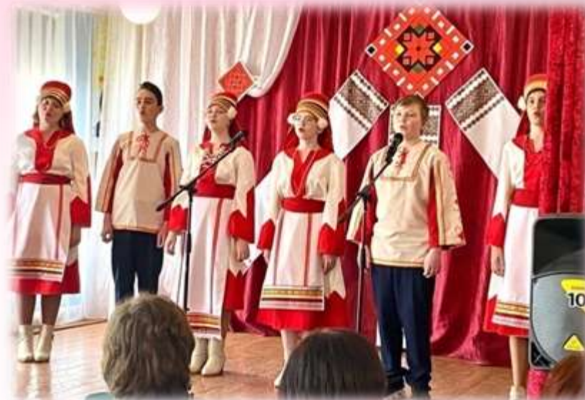
Коллектив Больше-Маресевской СОШ»