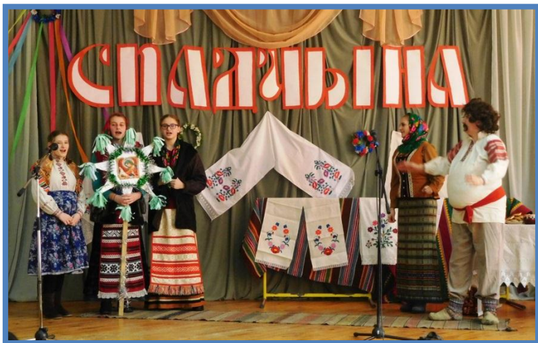
Калектыў Дзмітравіцкай сярэдняй школы, раённы дзіцячы фальклорны фестываль “Спадчына” (2017 год)

Актуальнасць дадзенага праекту абумоўлена магчымасцю прывіваць любоў маладога пакалення да фальклору, цікавасць і павагу да сваіх нацыянальных вытокаў – гэта спрыяе не толькі эстэтычнаму, але, перш за ўсё, грамадска-патрыятычнаму выхаванню навучэнцаў.