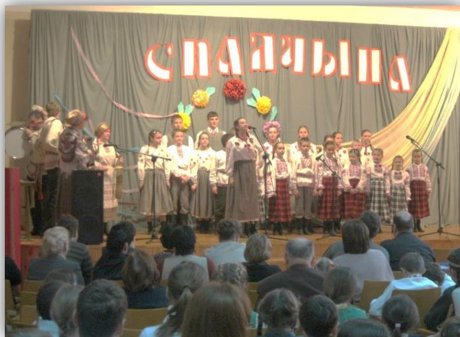
Урачыстае адкрыццё фестывалю “Спадчына” (2011 год)

Па-першае, неабходна знайсці будучых удзельнікаў конкурсу. Падчас гэтай кампаніі ўжываецца як масавая, так і індывідуальная работа: можна выкарыстоўваць запрашэнні, улёткі, стэнды, радыё – выбар сродкаў залежыць ад маштабнасці фестывалю і ад традыцый кожнай канкрэтнай установы адукацыі. Галоўнае зрабіць так, каб жадаючых было шмат.