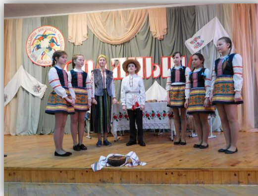
Раённы дзіцячы фальклорны фестываль “Спадчына” (2019 год)