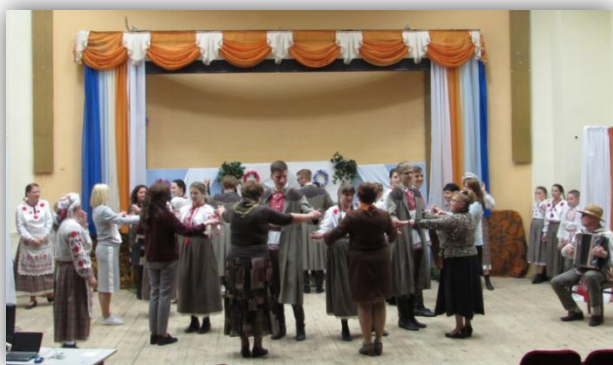
Міжрэгіянальны майстар-клас “Вывучэнне велікодных традыцый Камянецкага раёна”

Фінальная імпрэза фестывалю, якая планавалася 5 лютага 2023, у сувязі з неспрыяльным эпідэміялагічным становішчам была праведзена ў завочнай форме (аналітычная справаздача – дадатак № 3).