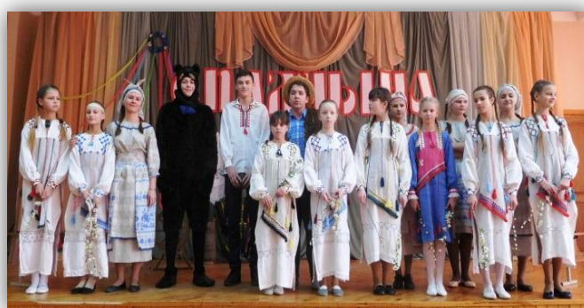
Раённы дзіцячы фальклорны фестываль “Спадчына” (2017 год)