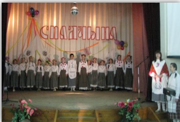
Урачыстае адкрыццё раённага дзіцячага фальклорнага фестывалю “Спадчына” (2009 )

Рабочая група: настаўнікі школ, кіраўнікі фальклорных калектываў, носьбіты народнай культуры, спонсары.