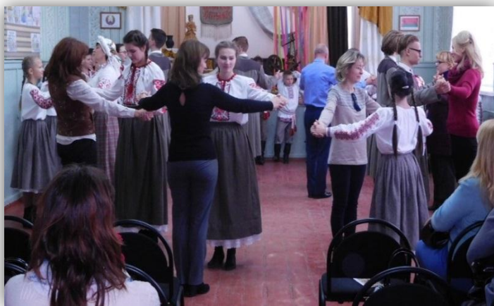
Майстар-клас па побытавым танцам

Папярэдні кантроль закрываў рэсурснае забеспячэнне праекта (кадравыя, матэрыяльныя і фінансавыя рэсурсы) і ажыццяўляўся да фактычнага пачатку дзеяння праекта. Па