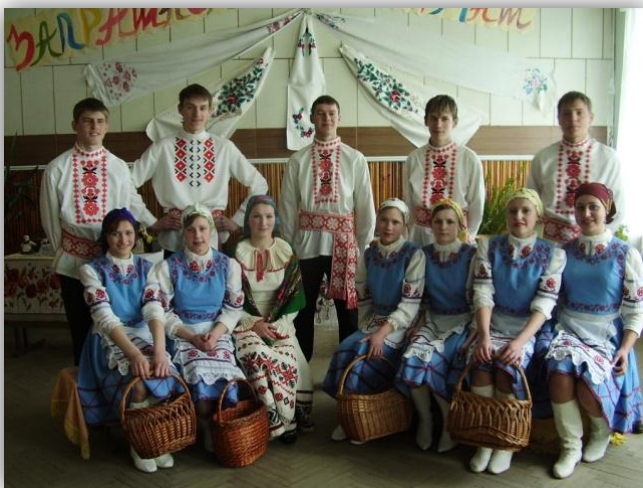
Калектыв ДУА “Гімназія г. Каменца”, раённы дзіцячы фальклорны фестываль “Спадчына” (2007 год)

шматфункцыянальны характар і забяспечвае творчае ўзаемадзеянне калектываў розных выканальніцкіх узроўняў.