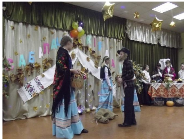
Дадатак 6.6. Вячоркі ў Забалаці