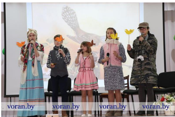
Дадатак 6.4. Курчоўскія калядкі