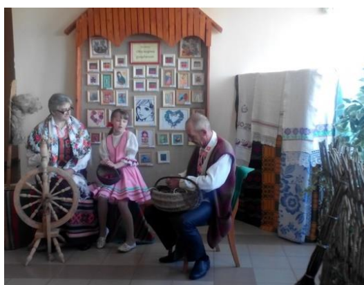
Дадатак 6.8. Багач